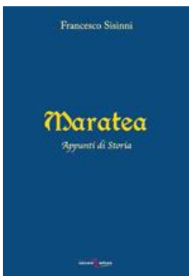
di Francesco Sisinni, Zaccara , 2019; Libri Storia e archeologia